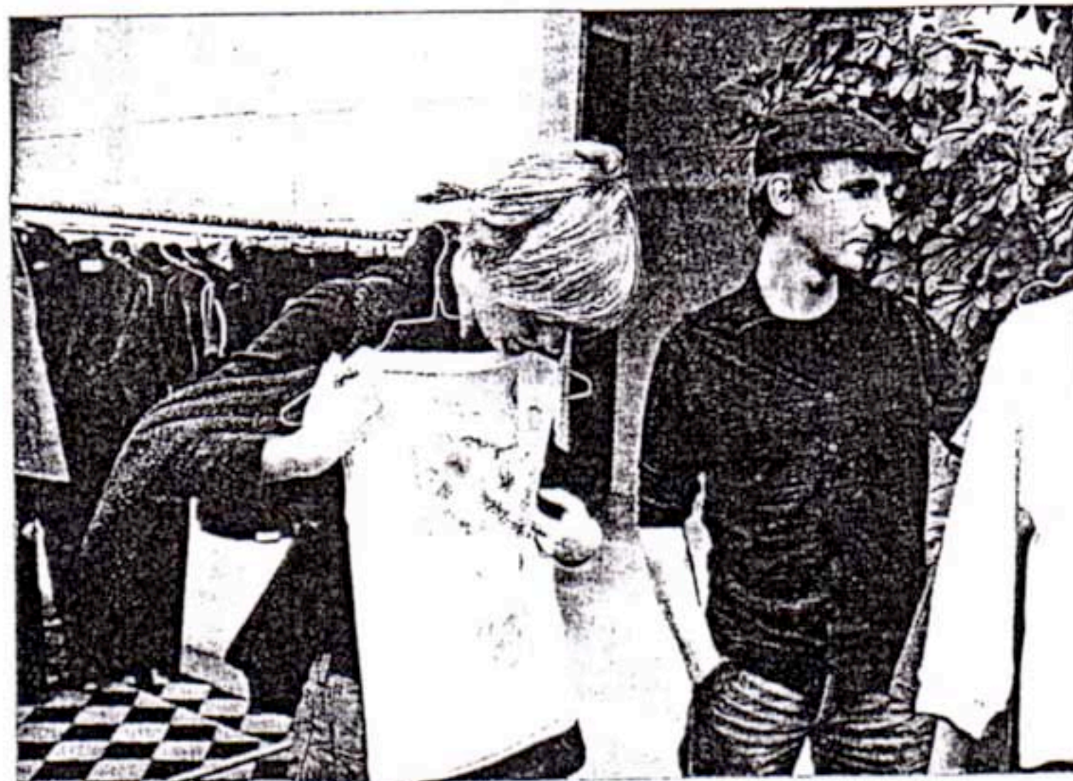
... und dann sofort schauen, wie sich die tollen Stücke am eigenen Körper machen würden.